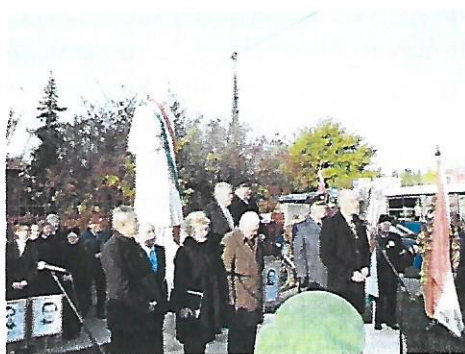
Nemzetőr szobor budapest XVII. kerület

Ducsa Attila http://ujhely56.hu/?page_id=89